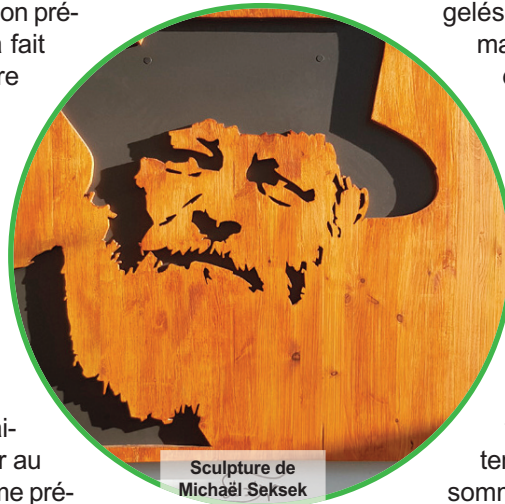
Sculpture de Michaël Seksek

C'était en 5751-1991, je faisais la queue pour le dollar au 770, plusieurs personnes me précédaient. En attendant mon tour je pensais que j'aimerais vivre suffisamment longtemps pour voir Machia'h et le troisième Beit Hamikdach. En arrivant devant le Rabbi un moment plus tard, il me regarda et me dit « Amen ».