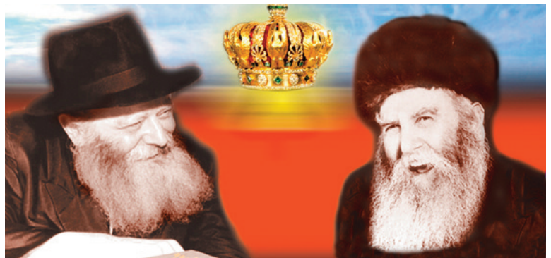
Le Rabbi Chlita Roi Machia'h et le Rabbi Yossef Its'hak, le Rabbi précédent