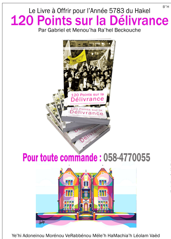
Illustration: Anshie Kasgen

Notes : 1/ Talmud Avoda Zara 9a, 2/ Torah Or, 3/ Vayikra Rabba 13