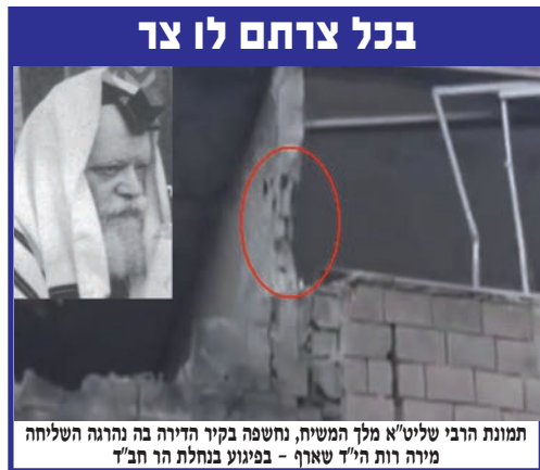
תמונת הרבי שליט"א מלך המשיח, נחשפה בקיץ הדיוה בה נהרגה השליחה מיהוה רות ה"ד שארף - בניגוע בנחלת הר חב"ד

ביום שני הקרוב י"ט כסלו, יחול חג הגאולה, גאולת אדמו"ר הזקן בעל התניא והשולחן ערוך, ממאסרו ברוסיה, עימה השתחררה תורת החסידות תורתו של משיח, על כל סודותיה ועומקיה וניתנה לנו. זו הזדמנות נפלאה עבורנו לקבלת החלטות טובות, ללמוד עיני גאולה ומשיח ולחיות בהם עדי התגלות המלאה והמושלמת של הרבי שליט"א מלך המשיח, עכשיו ממש.