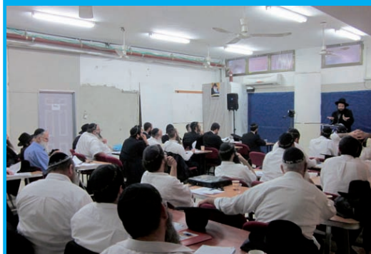
כהוראתו של הרבי שליט"א מלך המשיח ללמוד עניני גאולה כדי לזרז את הגאולה האמתית והשלימה, משתתפים מידי שבוע עשרות, בשיעורי "בית הספר לתורת הגאולה" ביוזמת מרכז ההפצה - ממש

בבואנו מחג השבועות בו צוינו שלוש האישים: משה רבינו שהביא את התורה לישראל, דוד המלך, מחבר ספר תהילים ורבי ישראל בעל שם טוב, שיום ההילולא שלהם חל בשבועות, מודגשת הוראתו באמירת חת"ת (חומש, תהילים תניא):