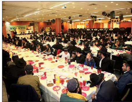
חלק מהקהל הרב

האירוע נעל במחרוזת שירים, המלווים את הקהל בדרכו, רבים עוצרים בדוכני "יריד גאולה ומשיח" ורוכשים מוצרים להפצת הגאולה. עשרות נשארים להתוועדות חסידית לתוך הלילה, בדרישה לגאולה האמיתית והשלימה.