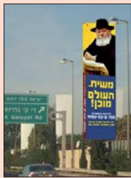
השלט בנתיבי איילון

המוקדנית מציעה לו לקבל על עצמו החלטה טובה, ותוך כדי נסיעה הוא מפרט את התחום בו יוסיף בעז"ה בתורה ובמצוות בלי נדר.