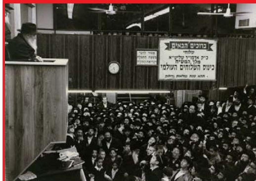
בהתוועדות עם הרבי שליט"א מלך המשיח, בצהרי השבת, יפתח "כינוס השלוחים העולמי". בתמונה: השלוחים מול המשלח בשנת תשנ"ג.