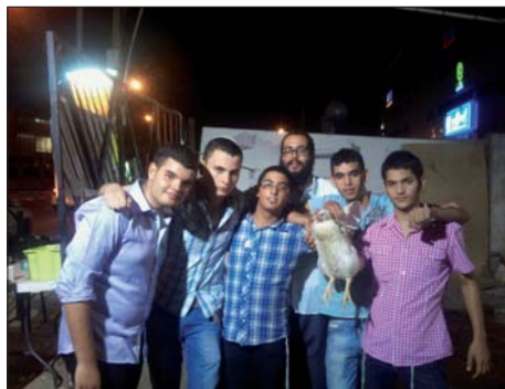
בפעילות "פרות" עם הצעירים

על אותן נשמות מתעוררות, מספר הרב קורקוס: "אחד מאותם בני נוער, ריגש אותי במיוחד באחת ההזדמנויות, כאשר נפגשתי איתו, והוא סיפר לי שבכל פעם לאחר סעודת שבת אצילנו, הוא לא מצליח לחלל את השבת. "כאילו שהצולנט שלכם עומד לי בגרון ומונע ממני מלעבור את העבירה" הוא אמר. לא מעטים מתוכם מציינים את השינוי החיובי והחזרה לחיי שמירת תורה ומצוות לאותם לילות שבת". כאמור בימים אלו עבר המקום למשכנו החדש מתוך מטרה להרחיב את הפעילות ולהעמיק את ההשפעה על אותם צעירים. כל המעוניין לסייע בפעילות הברוכה, מוזמן ליצור קשר עם הרב שלמה יעקב קורקוס, טל': 054-655-1721.