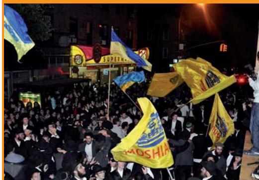
מדברי הרבי המהר"ש: כשיבוא משיח יקדו ברחובות. בתמונה: מראה שמחת בית השואבה ברחובה המרכזי של שכונת קראון הייטס

יד ההשגחה העליונה ניכרת ביותר בזעזועי שלטון אלו, כאשר המציאות החדשה במדינות ערב אלה מאלצת אותן להתייחס תחילה לתסיסות החברתיות שנחשפו ופוגעת ביכולתן, לפעול צבאית במישרין או בעקיפין, כנגד עם ישראל. פן נוסף לדברי הנביא ישעיהו נביא הגאולה: "וסכסכתי מצרים במצרים ונלחמו איש באחיו ואיש ברעהו, עיר בעיר ממלכה בממלכה". ואכן