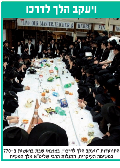
התועדות "ויעקב הלך לדרכו", במוצאי שבת בראשית ב-770 במשימה העיקרית, התגלות הרבי שליט"א מלך המשיח