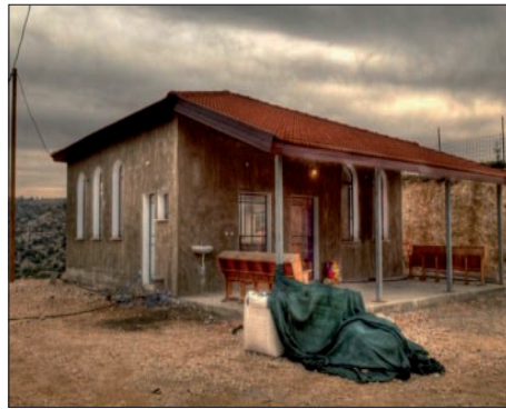
בית הכנסת ביישוב אל-נתן

במקום יש ב"ה כחמישה מבנים, וכן בית הכנסת 'שירת יהונדב' ע"ש של יהונדב הירשפלד הי"ד שנרצח בטבח בישיבת מרכז הרב. בגרעין המאחז אומרים: "אנו נבנה בכל מרחבי ארץ קודשנו", "שום אדם בעולם לא יכול לבוא נגד החלטותיו של בורא עולם שהוריש לעם ישראל את הארץ" - מוסיפים. "שום הרס לא ירתיע אותנו מלבנות שוב, בעזרת השם, - אומרים בגרעין. במאחז נראים הרי הריסות - אך המתיישבים רק מתחזקים מכך, כלשון הפסוק: "וכאשר יענו אותו כן ירבה וכן יפרוץ", עדי הגאולה האמתית והשלמה, ע"י הרבי שליט"א מלך המשיח, תיכף ומיד ממש.