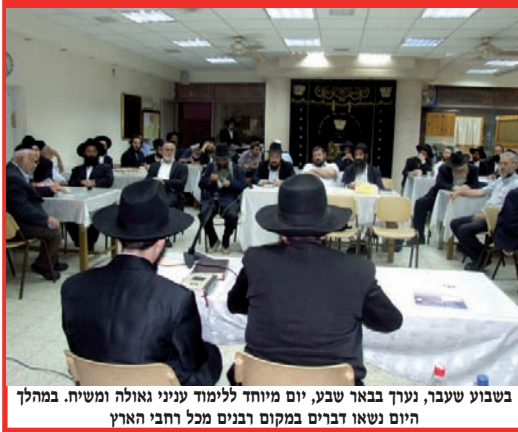
בשבוע שעבר, נערך בבאר שבע, יום מיוחד ללימוד עניני גאולה ומשיח. במהלך היום נשאו דברים במקום רבנים מכל רחבי הארץ