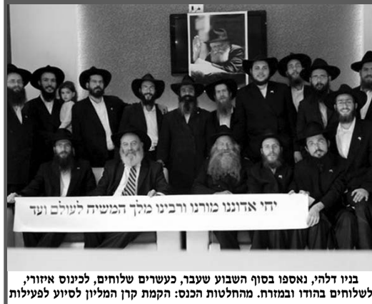
בני דלה, נאספו בסוף השבוע שעבר, כעשרים שלוחים, לכינוס איור, לשלוחים בהודו ובמזרח. המחלטות הכנס: הקמת קן המליון לסיוע לפעילות

יחי אדוננו מורנו ורבינו מלך המשיח לעולם ועד