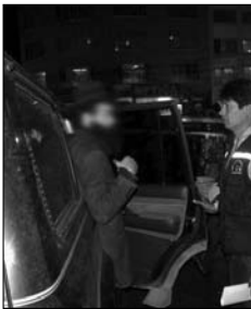
השליח יוצא מניידת המשטרה

לאחר מספר ימים, יצאנו לבתי התושבים היהודיים, ל"ביקורי בית". נפגשנו עם אישה אחת מהקהילה שסיפרה לנו שהבת שלה נמצאת בארץ. "היא למדה ניהול בתחום מסוים ולא מוצאת עבודה והיא שבורה ומדוכאת, כי כבר הרבה זמן היא מחפשת ולא מוצאת..." סיפרה בקול נכאים.