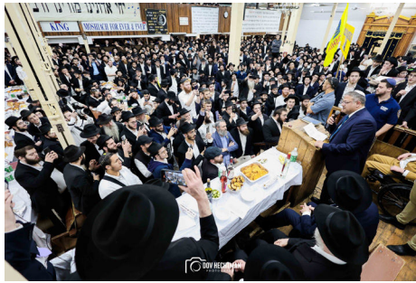
עם ההמונים ב-770.

בשיאו של הביקור הוא התבקש לנאום כחלק ממעמד סיום הלכות בלימוד הרמב"ם היומי שמתקיים דרך קבע בבית משיח - 770 (מדובר על כשמונים סיומים הנערכים לאורך השנה, באופן ייחודי), כשבדבריו התעכב על דברי הרבי שליט"א מלך המשיח בשיחה הידועה שנאמרה באותו יום בדיוק, שלושים-וארבע שנים קודם - שיחת כ"ח ניסן תנש"א "עשו כל שביכולתכם להביא את משיח צדקנו בפועל ממש", ועורר את הקהל להיצמד לדבריו והוראותיו הקדושים של הרבי שליט"א מלך המשיח ולהתעקש להבאת הגאולה.