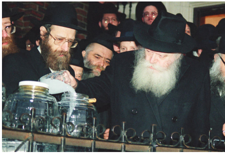
הרבי שליט"א מלך המשיח בשאיבת מים שלנו למצות

נהוג להעניק מתנות ביום הולדת, וכמובן שגם ליום הולדתו של מחולל התחייה היהודית הגדולה ביותר, ראוי להעניק מתנה – המתנות לרבי שליט"א מלך המשיח הן מתנות רוחניות – הוספה במצוות ובמעשים טובים, המזרזים ומביאים תיכף ומיד ממש את הגאולה האמיתית והשלמה. ■