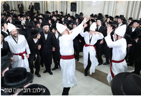
רוקדים בבגדי כהונה במהלך הכנסת ספר התורה

אין ספק כי עצם קיומו של אירוע שכזה, מכניס את הציבור לתודעה של בית המקדש והגאולה, מלבד העניין עצמו כי כעת ישנו ספר תורה מיוחד ומוכן לכך שיקראו בו על הר הבית לצד בית המקדש בקדושה ובטהרה. הדבר כמובן מהווה דחיפה ועידוד להמשיך ולהגביר עוד ועוד את הפעולות לזירוז הגאולה, במיוחד אלו אותן מציין הרבי שליט"א מלך המשיח כי יש להן קשר מיוחד לכך, כמו תפילה, צדקה, שמחה, ולימוד ענייני משיח וגאולה. פעולות אלו יחד עם המשך פרסום והפצת בשורת ונבואת הגאולה של הרבי שליט"א מלך המשיח, מזרזות את התגלות שתהיה תיכף ומיד ממש. ■