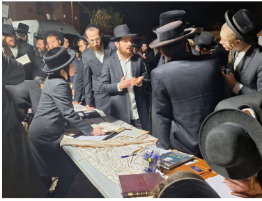
המונים בדוכן האגרות קודש בביתר עילית

אל הדוכן ניגש אברך. הוא הביט בתחלופת האנשים, בסקרנות זהירה. רעיון הכתיבה לרבי שליט"א מלך המשיח וקבלת תשובה דרך האגרות קודש - היה נשמע לו מוזר. אבל לבסוף החליט לבדוק