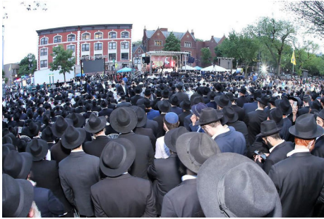
המעמד חול 770.

מעמד הסיום הינו גם הזדמנות מיוחדת לכל יהודי להצטרף לאחד ממסלולי הלימוד ולהיות חלק מאחדות כלל עולמית של אחדות דרך התורה. גדולי ישראל העידו כי הלימוד היומי ברמב"ם מביא לברכה והצלחה בכל תחומי החיים ו"הוא סגולה ליראת שמים ולבער החיצונים" כפי שכתב המגיד ממזריטש לתלמידי אדמו"ר הזקן בעל התניא.