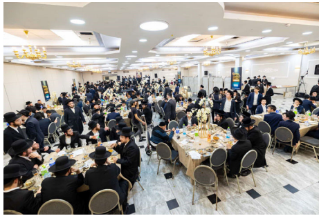
חלק ממשנתפי הוועידה השנתית

כמו כן, הארגון מפעיל תכניות חינוכיות לבני נוער, המשלבות לימודי חסידות, סדנאות יצירה וסיורים במקומות קדושים. תכניות אלו זוכות לשבחים רבים מכל המשתתפים כשהם מושם דגש מיוחד על העמקת הזיקה לחיבור הנצחי בין האמונה בביאת המשיח שהיא מעיקרי היהדות לפעולות מעשיות לזירוז הגאולה האמיתית והשלימה. בנוסף, הארגון מפעיל פרויקט ייחודי להפצת ספרי חסידות לבתי כנסת ברחבי הארץ, מתוך מטרה להפוך את תורת החסידות לנגישה יותר לכלל הציבור.