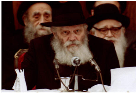
הרבי שליט"א מלך המשיח, פסח שני תש"מ

בזמנים של מתיחות ואי-ודאות עולמית, דברי הרבי שליט"א מלך המשיח מגלים את התמונה הרחבה ואת הבטחון המלא שהעולם מתקדם לקראת תיקונו המושלם, והעם היהודי, בזכות אמונתו ומעשיו, מוגן תחת כנפי השכינה. חובתנו היא להמשיך ולהתחזק בעשייה רוחנית, מתוך ידיעה ברורה שהנה הגאולה האמיתית והשלמה, בקרוב ממש. ■