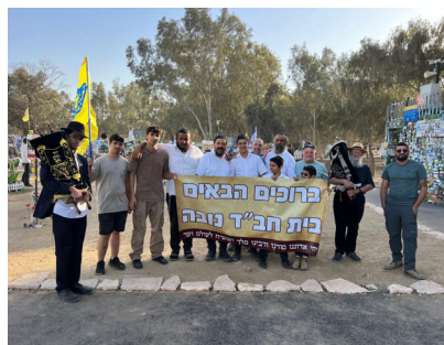
עם ספרי התורה בנובה מנחם מוולקנדוב (רביעי משמאל) במתחם בית חב"ד נובה (כתבה בעמוד האחורי)

אלא שבשתי פעמים אלו, לא נכבשה הארץ בשלימותה, עדיין נותרו ארצות הקיני הקניזי והקדמוני בידי האומות, הבטחה העומדת להתממש בקרוב ממש, עם התגלותו של הרבי שליט"א מלך המשיח, כאשר הפעם לא נצטרך להלחם מול האויב לקבלת ארצותיהם, אלא הם בעצמם יעניקו לנו, ויקיימו את ההבטחה הכתובה בתורה.