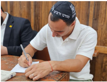
כתבים למלך המשיח ב-770 (ארכיון)

התשובה עסקה בחשיבות מצוות התפילין. קראנו יחד את המכתב האגרות קודש שנפתח לה בהשגחה פרטית, וניסיתי לברר אצלה מה ניסתית לברר אצלה מה ניתן לקדם בנושא מצווה חשובה זו