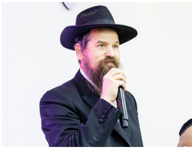
הרב אהרלה קופצ'יק

ספרו של הרבי שליט"א מלך המשיח 'היום יום...', מכיל פתגמים ואמרות חסידיות לכל יום בלוח השנה. בפתגם ליום ג' אלול נאמר: "המאמין בהשגחה פרטית יודע כי 'מה' מצעדי גבר כוננו", אשר נשמה זו צריכה לברר ולתקן איזה בירור ותיקון במקום פלוני. ומאות בשנים או גם משעת בריאת העולם הנה הדבר שצריך להתברר או להתתקן מחכה לאותה הנשמה שתבוא לבררו ולתקנו, וגם נשמה הלזו הנה מאז נאצלה ונבראה היא מחכה לזמן ירידתה לברר ולתקן את אשר הוטל עליה".