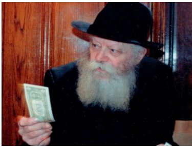
הרבי שליט"א מלך המשיח