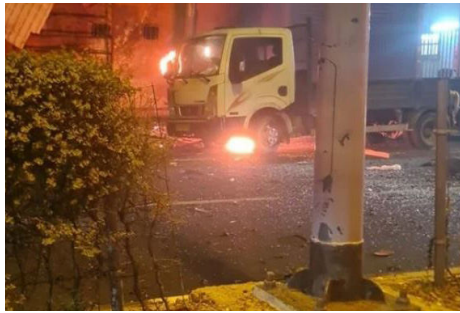
זירת הפיצוץ בתל אביב

עד שהוא לא מתבייש לצאת בריקוד בגלל הנסים הגלויים! כיון שהוא לא משכנע את עצמו שאין מה לרקוד ולהרעיש על הנסים שהקב"ה מראה, אלא אדרבה: הוא בא לידי הכרת האמת לאמיתו, (א) שהקב"ה מראה נסים גלויים, וכן (ב) שצריך להיות על כך בשמחה גדולה".