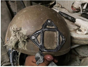
קסדת הנס. בצד נראה החלק שנפתח

מספר הרב שלמה קופצ'יק, שליח הרבי שליט"א מליובאוויטש מלך המשיח בשכונת נאות פרס בחיפה: