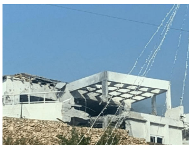
הפגיעה שריסקה את הבית באלפי מנשה

לצד כל האירועים הקשים שאירעו, נחשפים גם מספר עצום של מופתים וניסים המתחוללים מידי יום.