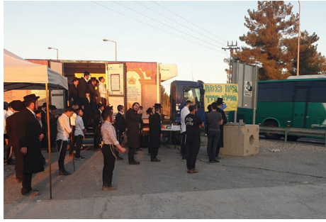
המתפללים גודשים את המקום

והסיפורים מתגלגלים... אדם שנכנס בוכה שהיום יום האזכרה לאביו והוא חשש להפסיד תפילה במניין, מגלה את בית הכנסת באמצע הדרך. אדם אחר שלא רצה לפספס הנחת תפילין גילה אותנו ממש ברגע האחרון לפני השקיעה, ועוד. ממש לפני כמה דקות חוייתי עוד נס, הוא מסיים את סיפורו, הגבאי היה צריך לקבל את המשכורת שלו, ולא ידעתי מאיפה יהיה את הכסף, רציתי לשאול אותו אם זה בסדר לעכב את התשלום בכמה ימים, אך, ממש כעת קיבלתי שיחת טלפון בה הודיעו לי על תרומה של אלפיים ש"ח. כמובן שכל התפילות והברכות במקום מוקדשים לזיורו הגאולה האמיתית והשלימה, בקרוב ממש". ■