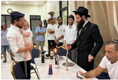
הרב נוטיק בהבדלה בבית חב"ד

"כאן ראינו נס נוסף", משתף הרב נוטיק. "בדיוק באותם ימים הגיע לביקור שליח הרבי שליט"א מלך המשיח בגואטמלה הרב אברמי מאירי, עם ידיד נעורים שהינו איש עסקים מנוסה. הוא שמע על המצוקה שלנו ונכנס לעסקי המשא ומתן, ובאופן מיידי השיג עבורנו תנאים מעולים. חתמנו על 'זכרון דברים' והכנסנו את המסמך לספר 'אגרות קודש'. הרבי שליט"א מלך המשיח העניק לנו במקום ברכה לחנוכת הבית, ואף כתב כי יעזור לנו במימון...! מאז שנכנסנו לבנין החדש כמות האורחים והביקורים זינקה, ובפסח האחרון כבר הסבו לליל הסדר 300 איש. הפעילות גודלת, ויש כבר תכניות נוספות לעתיד הקרוב. ברוך השם 'אל נידו' מוכנה לגאולה".