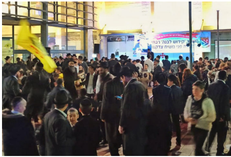
קהל גדול במעמד 'קידוש לבנה' בביתר עלית

"עשינו פרסומת בכל העיר, גם עם מודעות פרסום וגם עם כתבות בעיתונות המקומית. הפעם הראשונה הפתיעה אותנו באמת, הגיעו מאות אנשים והיתה שמחה אמיתית. זכינו להצלחה גדולה שאפילו לא ציפינו לה. באירוע מודגש כי הוא מתקיים לקבלת פני משיח בפועל ממש, והוא מלווה בהכרזה 'יחי אדוננו מורנו ורבינו מלך המשיח לעולם ועד'. מאז מתקיים המעמד באופן קבוע אחת לחודש ברוך השם".