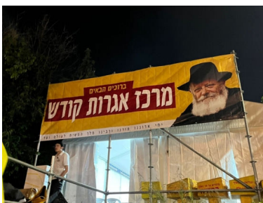
הדוכן במירון השנה

אלא שהמשטרה הודיעה מראש שלא תאפשר פתיחת מתחמים שכאלו באיזור הציון, אלא רק במתחם המורחב החדש, שנפתח למטרה זו למרגלות ההר