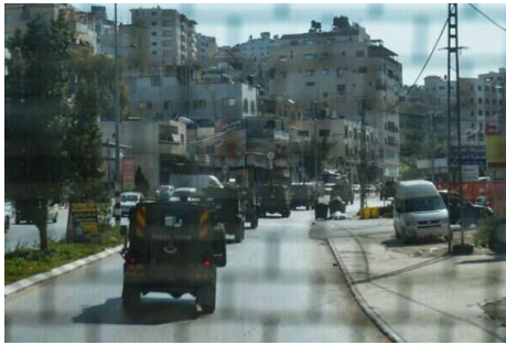
תיעוד מבצעי בשכם

יחד עם ההודאה על הניסים, הרי שיש לדרוש מהממשלה לעשות כל שביכולתה להגן ולשמור על חיי כל יהודי ולהפסיק מיידית כל משא ומתן עם הערבים הגורמים לעידוד הטרור, כפי שאומר הרבי שליט"א מלך המשיח. ■