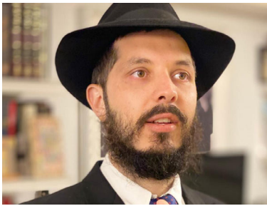
הרב בועז קליין

בני הזוג יצאו מחדר הרופא מוטרדים. כיצד יקחו על כתפיהם החלטה כה גורלית... הם החליטו לשאול שוב את הרבי שליט"א מלך המשיח