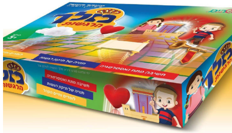
המשחק מלך הרגשות

הוא חבר לרב שמואל מיפעי, והפרייקט הלך והתקדם. כעת המשחק מוכן, והם יצאו בקמפיין 'הדסטארט' למימון המונים במטרה להגיע לסכום הדרוש להדפסת המשחק. זו למעשה אפשרות להזמין את המשחק ברכישה מוקדמת במחיר מוזל ולקבלו עד הבית. לתומכים בסכומים גבוהים יותר מצפות מגוון הפתעות, כפי שניתן לראות באתר.