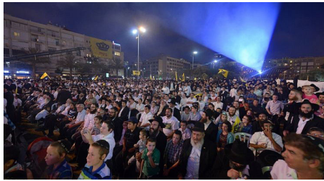
מראה כנס 'משיח בכיכר' בשנת הקהל הקודמת

מצביע על תפקידם של הכהנים בליל קריאת התורה של הקהל, ולהסתובב ברחובות ירושלים ולתקוע בחצוצרות, עד כדי כך שאמרו על כהן שאין לו חצוצרה 'דומה שאינך כהן'. כך גם אנו, אומר הרבי שליט"א מלך המשיח, צריכים להיות שיהיה ניכר על כל אחד שהוא אכן 'יהודי של הקהל', שזהו כל ענינו.