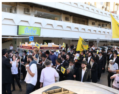
לקבלת פני הרבי שליט"א מלך המשיח מאות נטלו חלק בהכנסת ספר תורה לבית חב"ד בת ים, לזכות הרב זמרוני ציק

מיהו אותו משה רבינו? קובע הזוהר הקדוש כי בכל דור קיים משה רבינו, ולא רק באופן מטאפורי, אלא באופן מעשי כאשר הנשמה המיוחדת של משה רבינו, נכנסת אל אותו מנהיג רוחני הנציב לעמו. אך לא בכל הדורות היתה דמות שכזו שניצבה, להוביל בגאון את העם כולו בדרך התורה, בדורות האחרונים זכינו להנהגתם של רבותינו נשיאנו, החל מהבעל שם טוב לפני כשלוש מאות שנה דרך כל ממשיכיו ועד לדורנו, כאשר לפני למעלה משבעים שנה, עלה לנשיאות הרבי שליט"א מלך