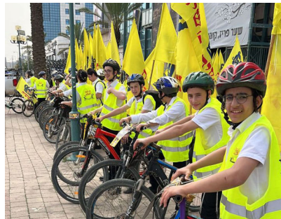
הצעירים עם האופנים האירוי את תל אביב שיירת אופניים של צעירים חב"דים, ב"א ניסן, הביא את בשורת הגאולה לאלפי תושבים

נשמתו של הרבי שליט"א מלך המשיח, מוגדרת בתורת החסידות "יחידה הכללית", כזו המחוברת לכל יהודי באופן אישי בדרגת היחידה, שהיא עצם נשמתו של כל אדם. משכך, גם אנו יכולים לפעול ולהוסיף חיים בו עצמו, זאת עושים על ידי ההכרזה "יחי אדוננו מורנו ורבינו מלך המשיח לעולם ועד", הכרזה, שתוכנה התבאר בשיתחב"ב ניסן תשמ"ח, הכרזה שמשמעותה קבלת מלכותו ודרישה כלפי שמיא להתגלותו לעין כל, תיכף ומיד ממש.