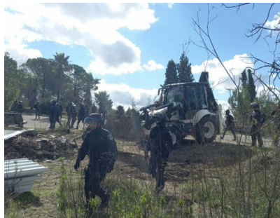
הרצח וגם ירשת? כוחות ההרס בישוב חומש הורסים את מבנה הישיבה

כל זה לא ריפה את ידי התלמידים. בחורפים קרים ובימי שמש קופחים הם מגיעים ללמוד תורה במקום. במבנים מאולתרים הם הקימו את בית המדרש, שם נשמע קול התורה, תוך ציפיה להקמתו המחודשת של הישוב. על קיר בריכת המים הנצפת למרחוק, מופיעה הכתובת הבולטת "חומש תחילה", תוך הבנה כי בעזרת ה' החזרה לחומש, תניע את הגלגל לביטול כל הליך הגירוש, וחזרה לכל הישובים.