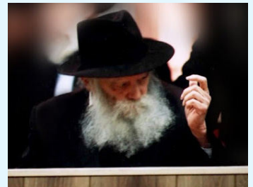
מעודד את שירת "יחי אדוננו"

מלך הוא אדם השולט על העם ומנהיג אותו. אך לא זו בלבד, המלך נקרא גם "לב העם". הלב הוא האיבר שממנו זורם הדם לכל איברי הגוף, ועל ידו נעשה כל הגוף חי. למעשה חיות האדם עוברת דרך הלב. כשאומרים שהמלך הוא לב העם - הכוונה בכך היא שהמלך הוא זה שנותן חיות לכל העם וחיותם של העם תלויה במלך ועוברת דרכו!