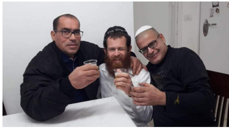
בהתוועדות ספונטניות עם החברה בישוב

גם בניצן, מגוון הפעולות השונות בשליחות נעשות מתוך כוונה מיוחדת לקבל את פני הרבי שליט"א משיח צדקנו תיכף ומיד ממש! ■