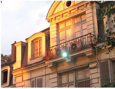
חזית ישיבת חב"ד בברינואה, צרפת