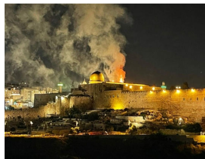
"ובאש אתה עתיד לבנותה" ממראות השבוע בירושלים. תזכורת לבית המקדש שירד משמים עם חומות אש סביב

התפרצות סבב האלימות החמור שראינו השבוע מצד התושבים הערבים ברחבי ישראל ועמידתם לצד חבריהם המחבלים מעזה וירושלים, הפתיעה רבים. אך כרגיל, הכתובת הייתה על הקיר. במשך שנים ארוכות מזהיר הרבי שליט"א מלך המשיח, כי הכניעה לטרור הערבי, לא תגרום דעיכה במעשים, אלא אדרבה התגברות והתעצמות תוך שחוצפתם תגבר, והנה השבוע שוב קיבלנו תזכורת כואבת להתממשות דברי אזהרתו.