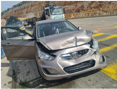
הרכב המרוסק לאחר התאונה

גם בפעם הזאת, כמו באין ספור פעמים לפניה, הוכח שוב שקיום הוראותיו של הרבי שליט"א מלך המשיח מביאים לשמירה והצלה מייוחדת, גם כשזה לא הגיוני בדרך הטבע