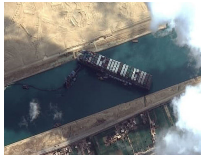
'פקק' בתעלת המים יוצר תגובה עולמית האוניה אבר גיבן תקועה לרוחב תעלת סואץ ומשפיעה בבת אחת על כל העולם כולו

שליט"א מלך המשיח בשיחתו הידועה באור לכ"ח ניסן תנש"א: "הדבר היחידי שיכולני לעשות - למסור הענין אליכם: עשו כל אשר ביכולתכם - ענינים שהם באופן דאורות דתוהו, אבל, בכלים דתיקון - להביא בפועל את משיח צדקנו ותיכף ומיד ממש!". ובהמשך אותה שיחה אומר: "ויהי רצון שימצא מכם אחד, שנים, שלשה, שיטכסו עצה מה לעשות וכיצד לעשות, ועוד והוא העיקר - שיפעלו שתהי' הגאולה האמיתית והשלימה בפועל ממש, תיכף ומיד ממש, ומתוך שמחה וטוב לבב."