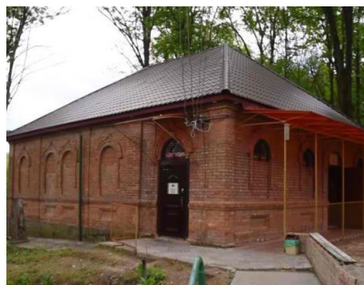
כ"ד טבת - יום ההילולא אדמו"ר הזקן "איני רוצה את הגן עדן שלך, איני רוצה את העולם הבא שלך... אני רוצה אותך בעצמך"

השבוע, עם פתיחת ספר הגאולה, ספר שמות, אנו פוגשים את דמותו של הגאול הראשון - משה רבינו, הנולד במצרים ומתכונן לתפקידו הגדול בשליחות הקדוש ברוך הוא.