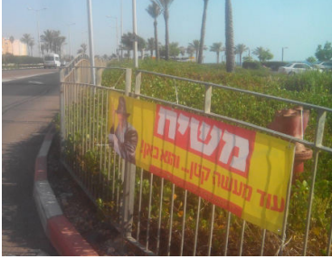
שלט פרסום משיח.