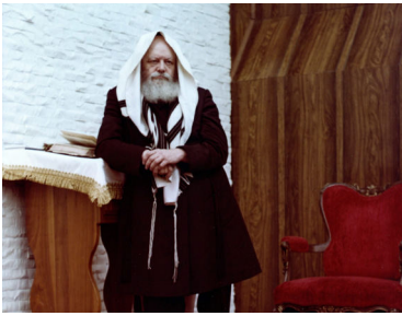
הרבי שליט"א מלך המשיח

עם תחילת תקופת החששות מנגיף הקורונה, בליבה של הדר, כמו אצל יהודים רבים וטובים, ההרגשה שהנה הנה הרבי שליט"א משיח צדקנו מתגלה ומביא לכולנו את הגאולה האמיתית והשלימה