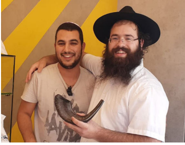
הרב חיים טל

דממה השתררה בשולחן ההתוועדות. דממה של הלם וזעזוע. הראשון שהתעשת היה הרב חיים טל: "במצב כזה, אתה מוכרח לבקש ברכה מהרבי שליט"א מלך המשיח. רק הוא יוכל להושיע אותך!"