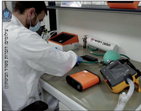
מייצרים מכונות הנשמה במפעל הטילים הארגון נותנים סיוע אזרחי-רפואי במקומות רבים בלבנון, בעיקר בקרב האוכלוסיה השיעית - המהווה את בסיס הכח של הארגון.