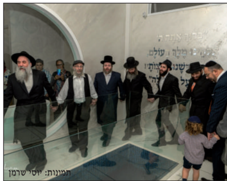
חוקדים במבנה החדש

"אנו תקווה כי זו תהיה הפעולה האחרונה טרם התגלותו של הרבי שליט"א מלך המשיח".