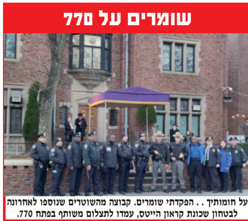
על חומותיך... הפקדתי שומרים. קבוצה מהשוטרים שנוספו לאחרונה לבטחון שכונת קראון הייטס, עמדו לתצלום משותף בפתח 770.

ונשאלת השאלה, האם בשביל לענות לטענת האומות,