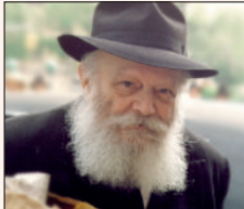
הרבי שליט"א מלך המשיח

עוגן החיזוק שלנו היה התשובות המעודדות שהמשכנו לקבל