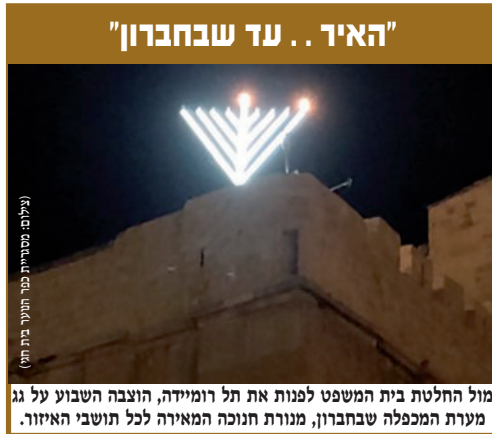
"האיר... עד שבחברון" מול החלטת בית המשפט לפנות את תל רומיידה, הוצבה השבוע על גג מערת המכפלה שבחברון, מנורת חנוכה המאירה לכל תושבי האיזור.

אלא שהחשמונאים, בבית המקדש השני, לא הסכימו לחשוב על פחות מהמקסימום. הלא כל מלחמתם בכובש האימנתי לא היתה על זוטות, לא חיים חופשיים עמדו לנגד עיניהם ולא רווחה גשמית. מאבקם ההרואי היה על האמונה בה' וכנגד אלו אשר ביקשו