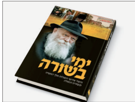
שער הספר החדש

בנשימה עצורה, מאזינים התלמידים לרבי יצחק המפליג בחזונו ומספר על התגרויות מלכי העולם זה בזה, מתאר את אומות העולם המתרעשים ומתבהלים ואת עם ישראל הזועק בהיסטריה "להיכן נבוא ונלך", אז באה צפירת