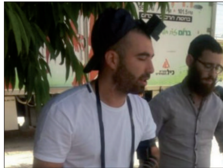
עומר אדם מניח תפילין

מרכיב עיקרי בהפצת ה'מבצעים' הוא פרסומם בכל דרך אפשרית, בין היתר באמצעות קיומם על ידי אישי ציבור ידועים - אשר אז, בנוסף לעצם זיכויים בקיום המצוות החשובות - כשמצלמים אותם בעת הנחת התפילין, הדלקת הנרות, קביעת המזוזה וכדו' ומפרסמים את תמונותיהם בעיתונות, בתקשורת וכו' - מצליחים להשפיע ולהביא את ה'מבצעים'