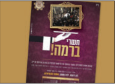
פרסום ההרשמה לקבוצת הבנות לתשרי

גם באירוע שמחת בית השואבה הענק, הנערך כל לילה ברחובות השכונה, עד לשעה 6 בבוקר, ניתן להן מקום בעזרת הנשים. כאן, כמו בבית המקדש בשעתו, כאשר חז"ל תיקנו