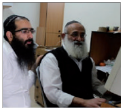
בעריכת שיחה לברייל

אכן הרבי שליט"א מלך המשיח לא נשאר חייב. וביום רביעי שעבר, י"ג אדר נולד לו בן שי' וביום רביעי השבוע חל יום הכנסתו בבריתו של אברהם אבינו.