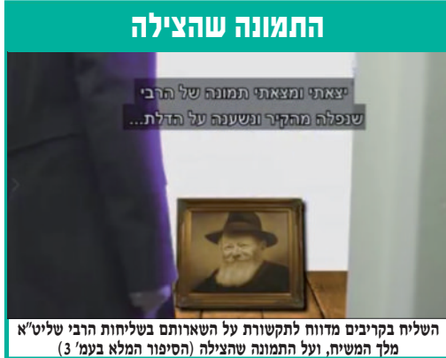
השליח בקריבים מדווח לתקשורת על השארתם בשליחות הרבי שליט"א מלך המשיח, ועל התמונה שהצילה (הסיפור המלא בעמ' 3)

בעוד שמבחינת התאריך בחודש, כ"ה באלול הינו היום הפעיל ביותר בבריאה, כולו עשיה, ואילו יום השבת קודש מציין את הפסקת היצירה בבריאה. "ויכל אלוקים ביום השביעי מלאכתו.. וישבות ביום השביעי מכל מלאכתו אשר עשה". ניגוד גמור. ביום שבת קודש אין מקום לשום עשיה של מלאכת חולין. לא רק שאין מקום לעשיה, אלא אפילו לדבר על כך או לתכנן עשיה כזו של מלאכת חולין, שהרי בבואנו ליום השבת קודש "יהא בעיניך כאילו כל מלאכתך