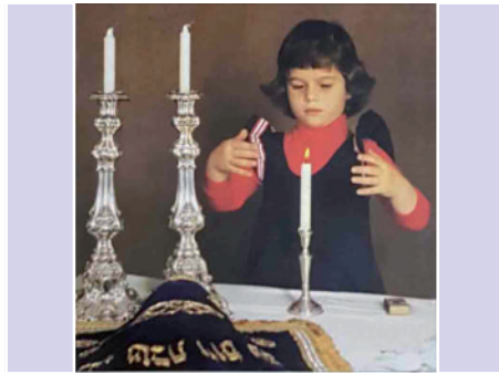
מבצע נש"ק - גם בת מדליקה נר שבת

והחלה לבכות ולהתחנן. האמא שהתקשתה לעמוד בזה הסכימה ובלבד שתניח לה! בהגיע זמן ההדלקה הילדה העמידה את הנר בשולחן האוכל הדליקה וברכה והרגישה "לעילא ולעילא!" ואח"כ הסתובבה והורתה לכל בני הבית להיזהר שלא לגעת בנר ולא להזיזו וכו'.