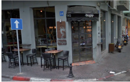
באגסי - מסעדה

קל?! בוודאי שזה לא היה. בטח לא בשכונה התל-אביבית כפלורנטיין. עבור צעירי השכונה והאיזור השני היה עוצמתי מידי. הם עזבו ואפילו בטריקת דלת. בפייסבוק השכונתי הופיעו פוסטים לא מחמיאים. "סוגרת בשבת? סוגרת את היחסים בינינו. זה כשר? אז אמצא מקום אחר" וכד', תגובות אופייניות לאוירת השכונה. העיתונות חגגה, והמסעדה נכנסה לתקופת "יובש" קשה.